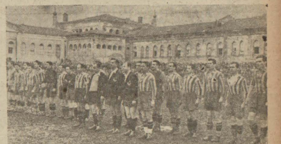
Galatasaray - Fener takımları bundan evvelki maçlardan birinde

Fener bu oyunda yenilirse lig şampiyonluğuna veda edecek, Galatasaray (Buduri) den mahrum kalmak tehlikesini atlattı