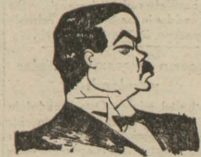
Japon hariciye nazırı Matsuoka

Vaşington 28 (A.A.) — Alman - İtalyan - Japon pakının imzası hakkında matbuat konferansına beyanatta bulunan hariciye nazırı Hull, ezümlerini şöyle söylemiştir: